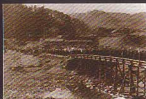
▲昭和初期のだるま市

高崎市鼻高町にある少林山達磨寺のだるま市は、同山七草の縁日に本堂前で掛け声勇ましく売り出されたのが始まりとされています。毎年正月六日の夜から七日にかけての少林山七草星祭のだるま市は関東一をはこり、境内に軒を並べただるま屋は、「拾万円、百万円、千万円(拾円、百円、千円)」と景気のよい声を張り上げ、参拝者は大小様々のだるまを手にとっていきます。その日同山の参拝者は50万人以上に及び、山頂の本堂前まで続く、だるま屋の灯の帯は、高崎の正月のクライマックスを彩ります。