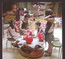
▲絵付け体験(今井だるま店での絵付け教室は電話にて予約下さい)