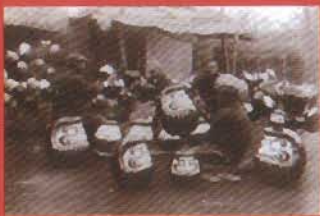
▲昭和初期制作風景

すべての工程をまったくの手作業で仕上げている今井だるまは、ひとつひとつがオリジナルです。職人の手の温もりがじかに感じられる逸品です。